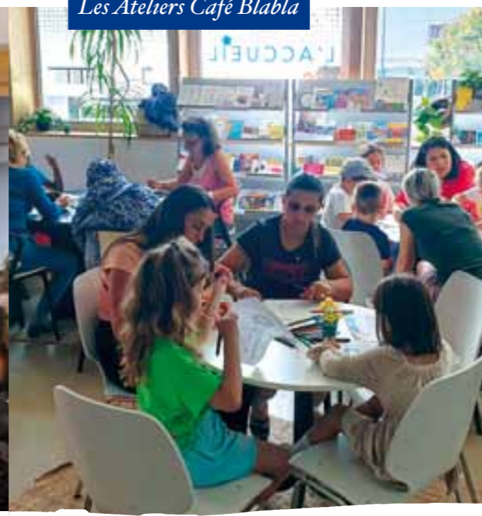
Les Ateliers Café Blabla

Ces moments peinent encore à se faire connaître, si ce n'est celui clairement axé sur la conversation en français. D'autres formules vont être tentées et la communication améliorée pour donner une chance à cette expérience de s'inscrire dans l'Accueil !