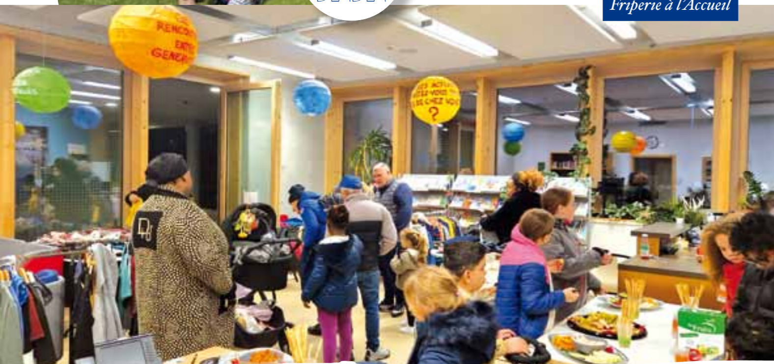
Friperie à l'Accueil

donc terminée avec cet apéro et une jolie fréquentation multigénérationnelle qui invite à réitérer l'expérience.